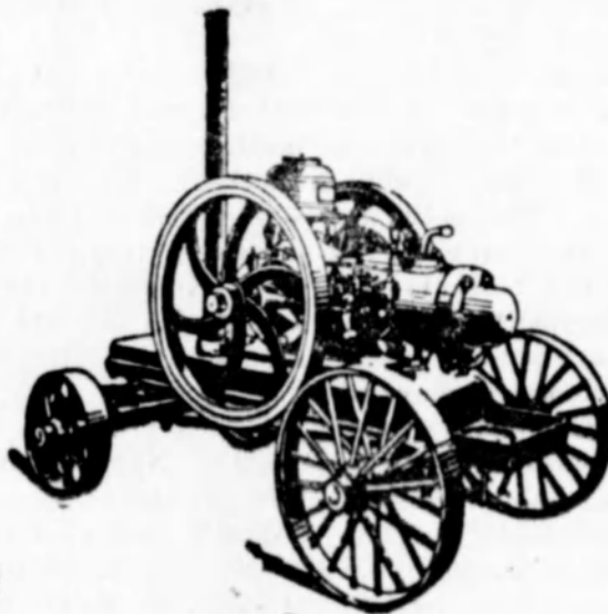
Ezernél több üzemben!