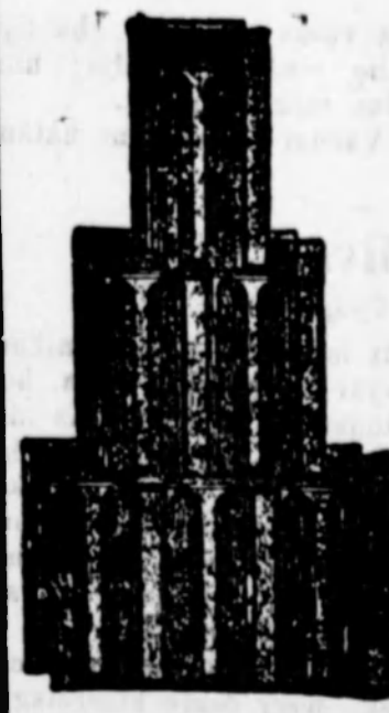
Bohn kikiáltási cserepe.

szívógázmotorok üzeméhez, gyári üzemekhez, vasalási célokra