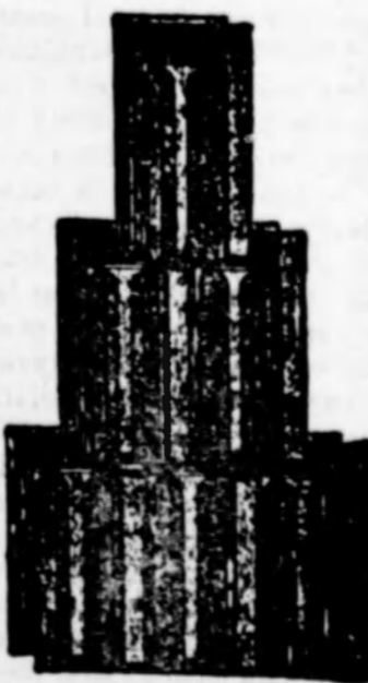
Bohn kilindai cserepe.