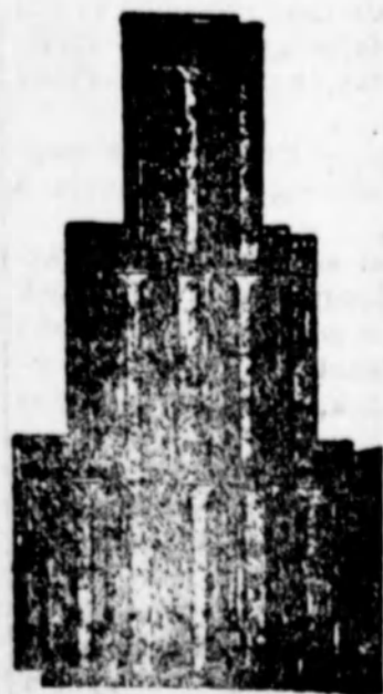
Bohn kikindai cserépe.

* Indítványok 3 nappal a közgyűlés előtt az elnökségnél írásban benyújtandók.